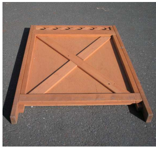
【後壁】× 5 枚