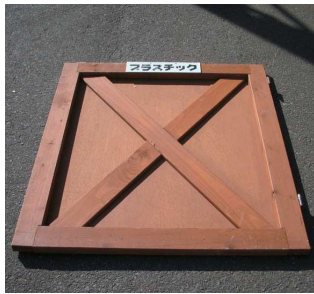
【扉】× 5 枚