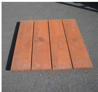
【スノコ】× 5 枚