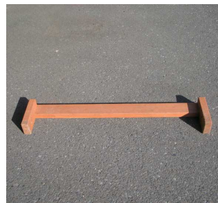
【前足】× 5 基