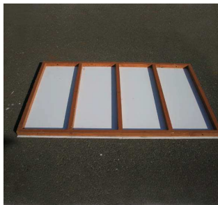
【屋根】× 5 枚