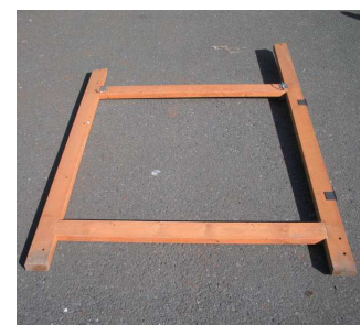
【中壁】× 2 枚