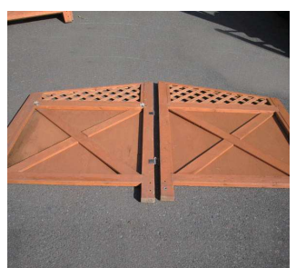
【横壁(左右)】× 各 1 枚