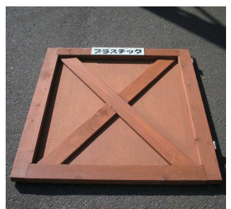
【扉】× 3 枚