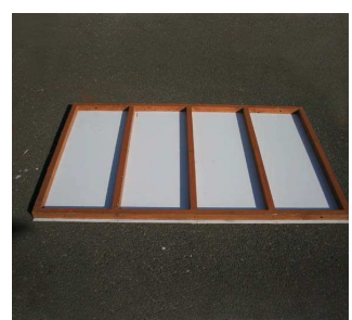
【屋根】× 3 枚