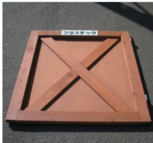
【扉】× 2 枚