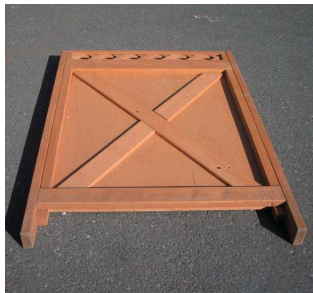
【後壁】× 2 枚