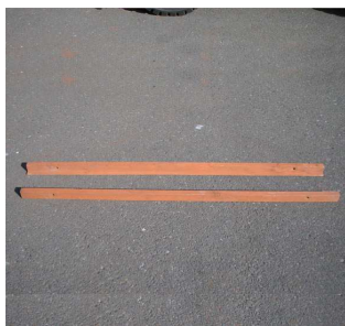
【屋根カバー】× 2 本