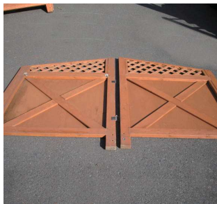
【横壁(左右)】× 各 1 枚