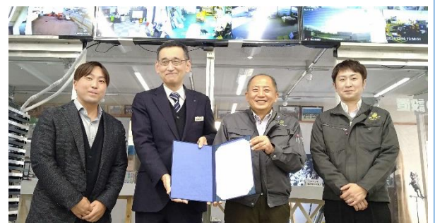
(左から)安井常務、河野局長、安井代表取締役、田村専務