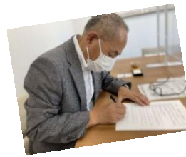
→(左から) 及川代表取締役、 河野局長